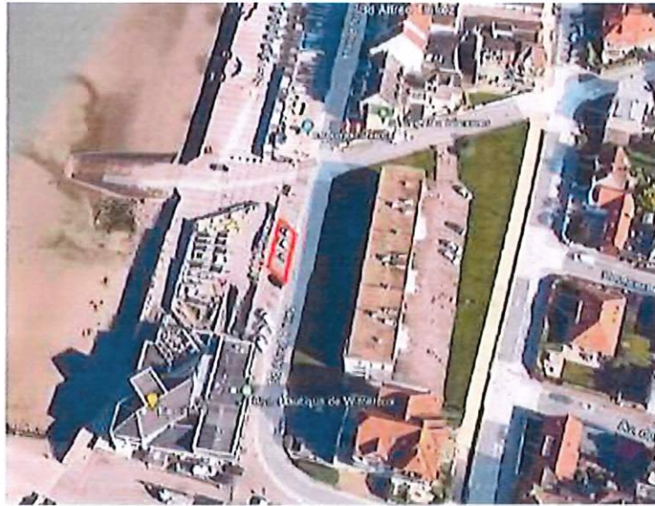
Article 3 du présent arrêté