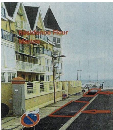
Avenue de la Mer